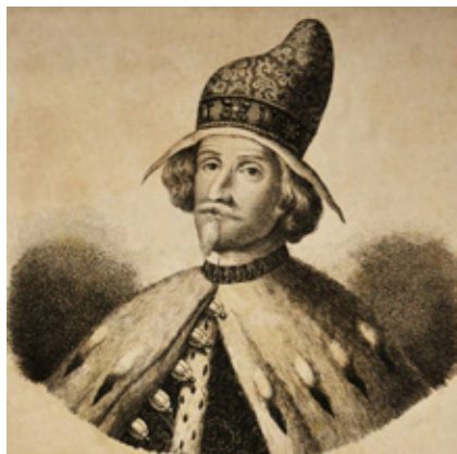
Ritratto del Doge Domenico II Contarini, Serenissimo Principe di Venezia dal 1659 al 1675.

o rosso cupo, tipico dei vessilli di mare veneziani e della divisa delle truppe Schiavone, fedelissime alla Dominante e imbarcate sia sulle navi, che a presidio delle piazzeforti di Terraferma e della Capitale stessa, Venezia.