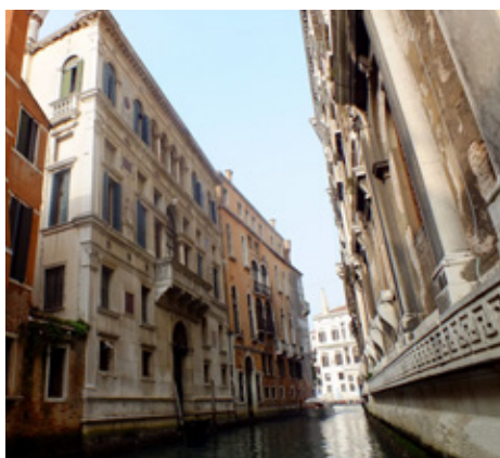
Il palazzo veneziano dove abitò e visse il Doge Domenico II Contarini (1585-1675) in San Marco 3980, oggi denominato Palazzo Contarini Mocenigo. La facciata è su Rio de San Luca.